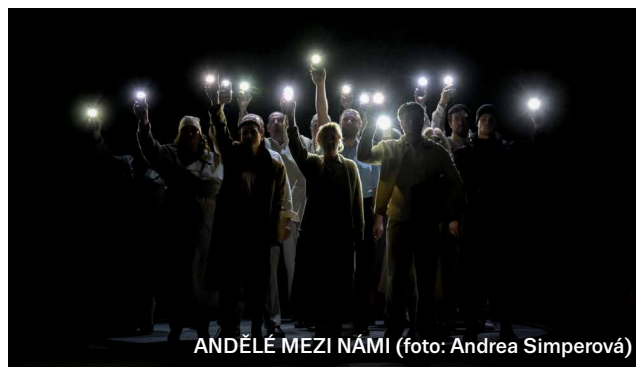
ANDĚLÉ MEZI NÁMI